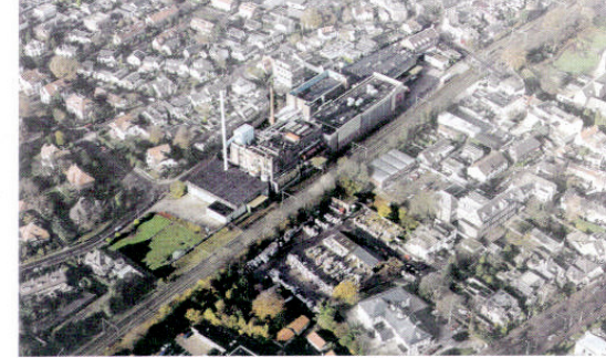
Situatie oud: fabriekslocatie & kantoorlocatie